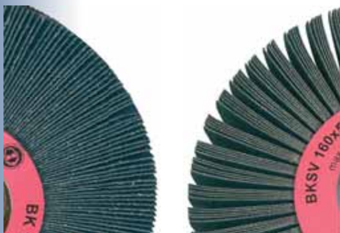
Detail lamel BK