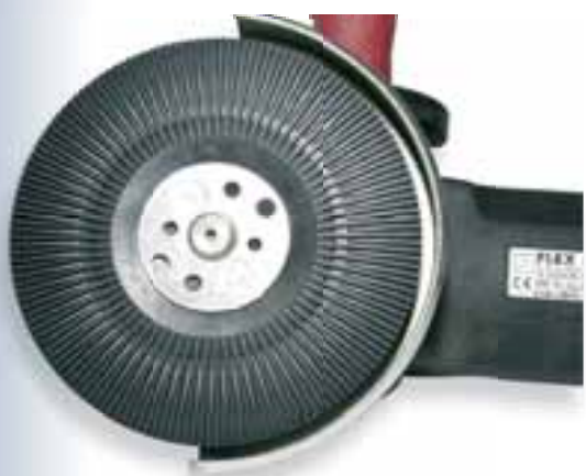
tvrdý / hard