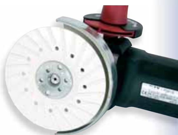
polotvrdý / half-hard

Podložné talíře se závitem M14 pro vulkanfibry na úhlové brusky. Vhodné pro práci s vysoce výkonným brusivem. Snižují teplotu